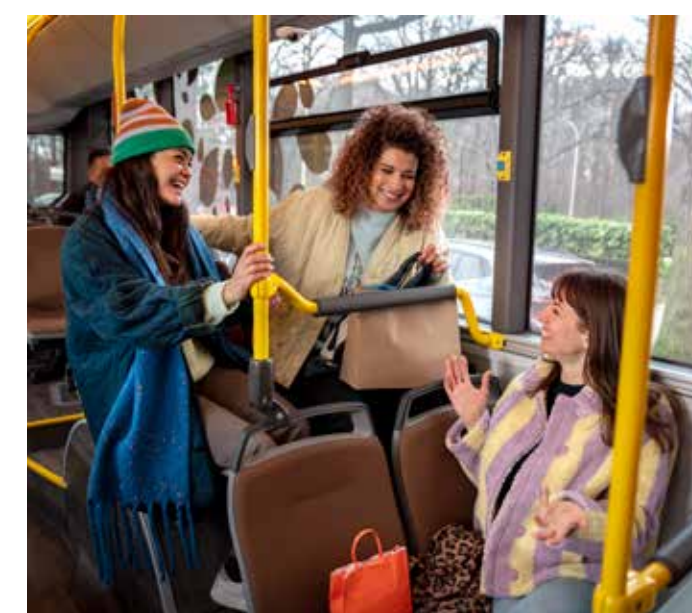
Wijzigingen steeds mogelijk. Raadpleeg delijn.be/nieuwenet voor meest actuele info.